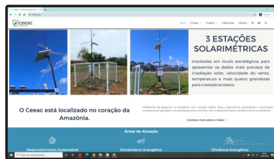
Novo Site do Ceeac